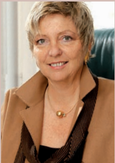
Rechtsanwältin und Notarin