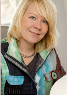
Rechtsanwältin Fachanwältin für Erbrecht Fachanwältin für Familienrecht