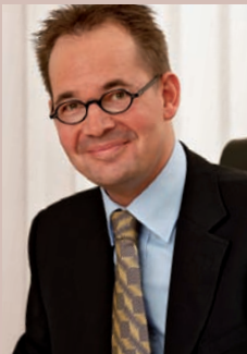
Rechtsanwalt und Notar

Spezialisierung ist für uns die Voraussetzung für kompetente Beratung und Vertretung. Nur Fachanwälte sind gesetzlich verpflichtet sich regelmäßig fortzubilden. Das gewährleistet für Sie eine erfolgreiche Beratung und Vertretung durch uns auf dem aktuellen Stand von Gesetzgebung und Rechtsprechung.